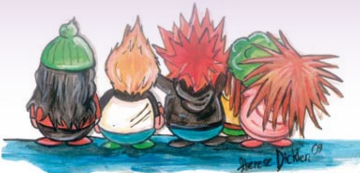
Teckning: Therese Dicklén

Kontakta oss om du vill veta mera om projektet.