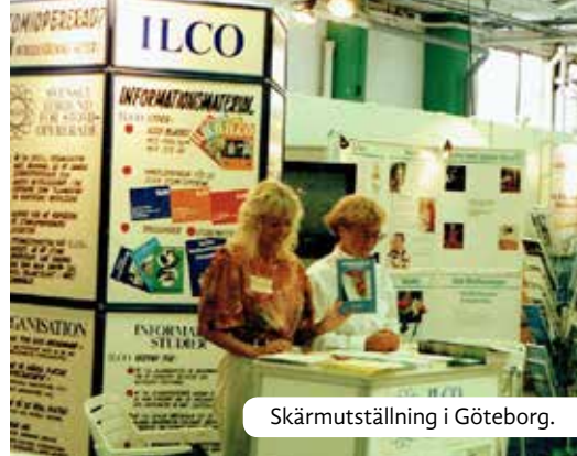
Skärmutställning i Göteborg.