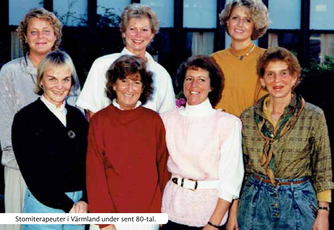
Stomiterapeuter i Värmland under sent 80-tal.