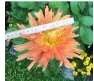
Förra året Dalian 140 cm